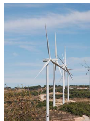
Parque Mudefer II