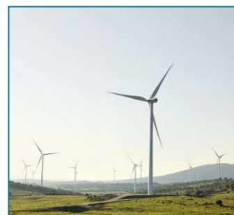
Pedregoso y Pino