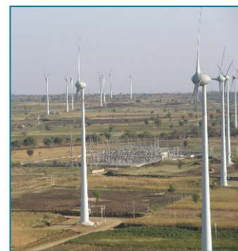
Parque de Gadag