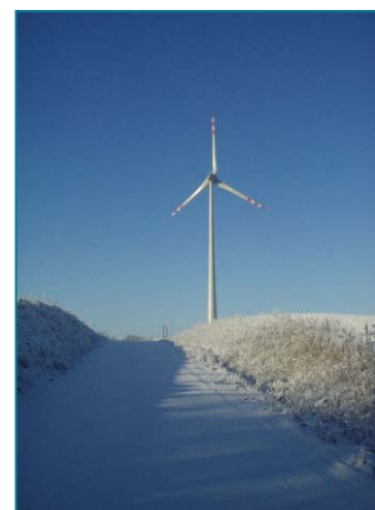
Fase I Kisielice